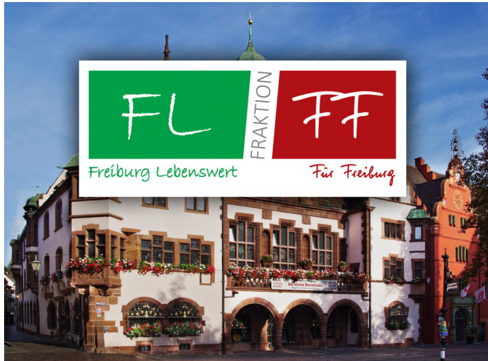
Die Fraktion FL/FF im Freiburger Gemeinderat

Zum Bild oben: Die Visualisierung der Staumauer bezog sich auf die früher schon einmal geplante Staumauer auf der Wiese hinter Günterstal. Jetzt ist sie weiter oben, im Bohrertal geplant, würde dort – im Falle einer Realisierung – aber ähnlich monströs und naturzerstörend sein. Der dort ansässige Landwirt Benedikt v. Droste wehrt sich zusammen mit vielen anderen gegen den unverhältnismäßigen Eingriff in die Natur sowie gegen die Zerstörung seiner Obstwiesen, die er für seine Existenz als Schnapsbrenner benötigt. Auch ihm droht nun die Enteignung.