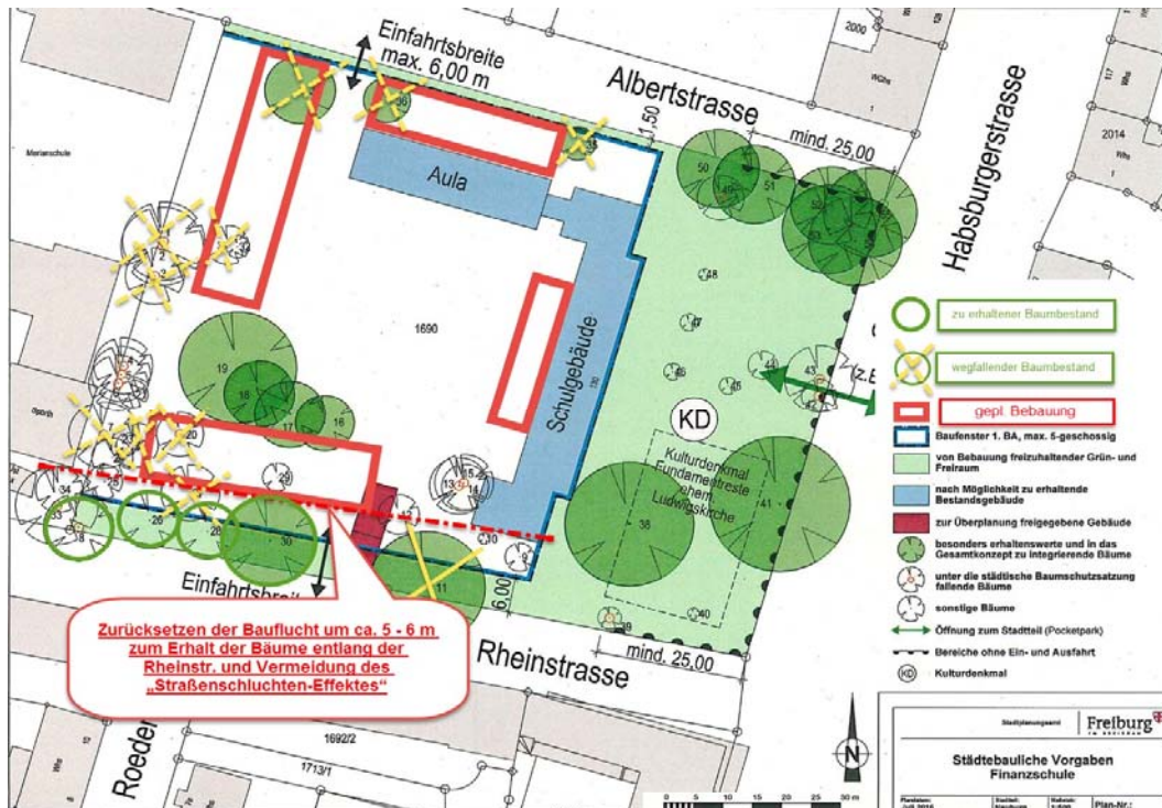
Abbildung 2: Vorschlag der Zurücksetzung der Bauflucht beim ersten Bauabschnitt um ca. 5-6 m und dadurch Erhalt der Bäume an der Rheinstraße