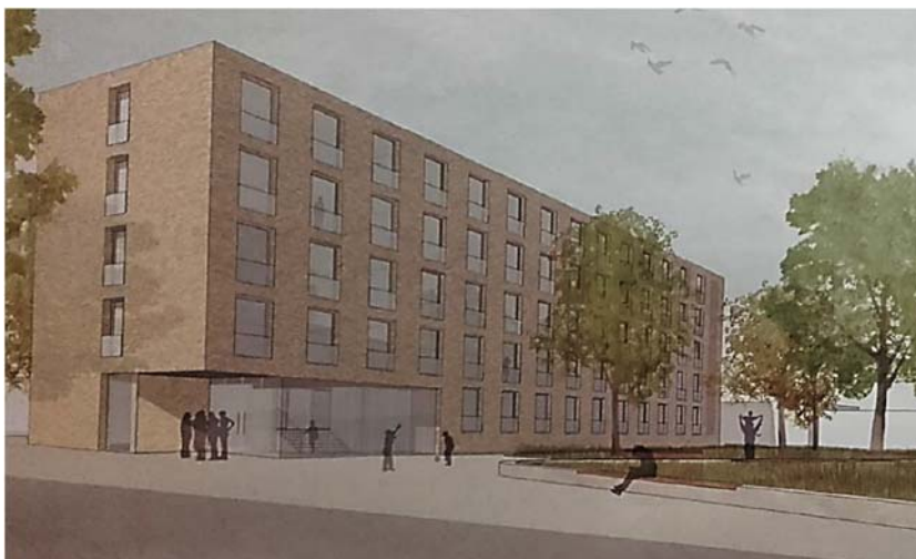
Abbildung 4: Geplanter, Kubus förmiger Neubau an der Rheinstraße (die aus dieser Perspektive hinter dem Gebäude liegt).

Dies aber NUR bei zurückgesetzter Bebauung um weitere 6 m zur Rheinstraße! Ansonsten entsteht bei näherer Bebauung direkt an der Rheinstraße und durch die Höhe des Gebäudes ein Straßenschluchteneffekt, zu Lasten der Anwohner.