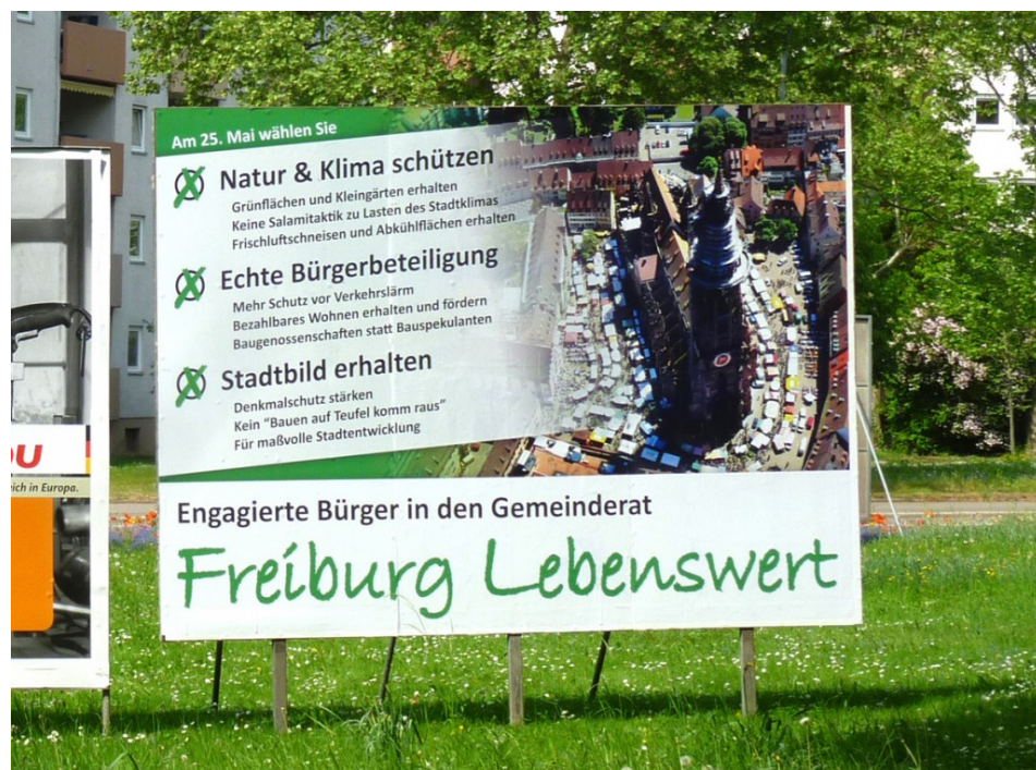
Plakat zur Gemeinderatswahl im Mai 2014

Siehe vor allem: Wofür wir stehen und unser Programm .