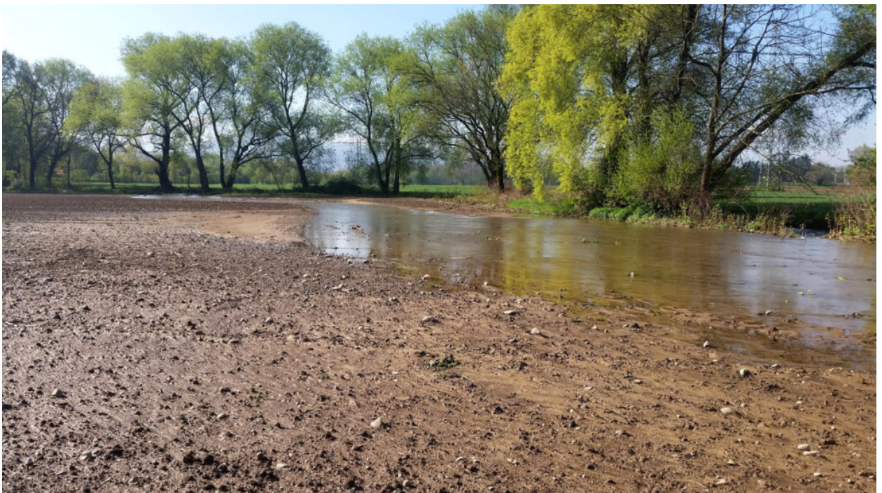
Hochwasser nach starkem Regen 2016 im Überschwemmungsgebiet Dietenbach.

Die Stadt hat damit Erfahrungen: Siehe dazu den Stadtteil Landwasser. Gebäude stehen im Grundwasser mit feuchten Kellern. Wer trägt dafür die Verantwortung? Die planende Stadt nicht! (So OB Salomon vor seiner Abwahl.) Der Stadtteil Hochdorf entwickelt sich auch in die Richtung! Auch hier trägt der Bürger die Folgen alleine! Und der Gemeinderat – oder der Teil des Gemeinderates, der diese Bebauungspläne damals auf Anraten der Stadt beschlossen hat – trägt natürlich auch keine Verantwortung.