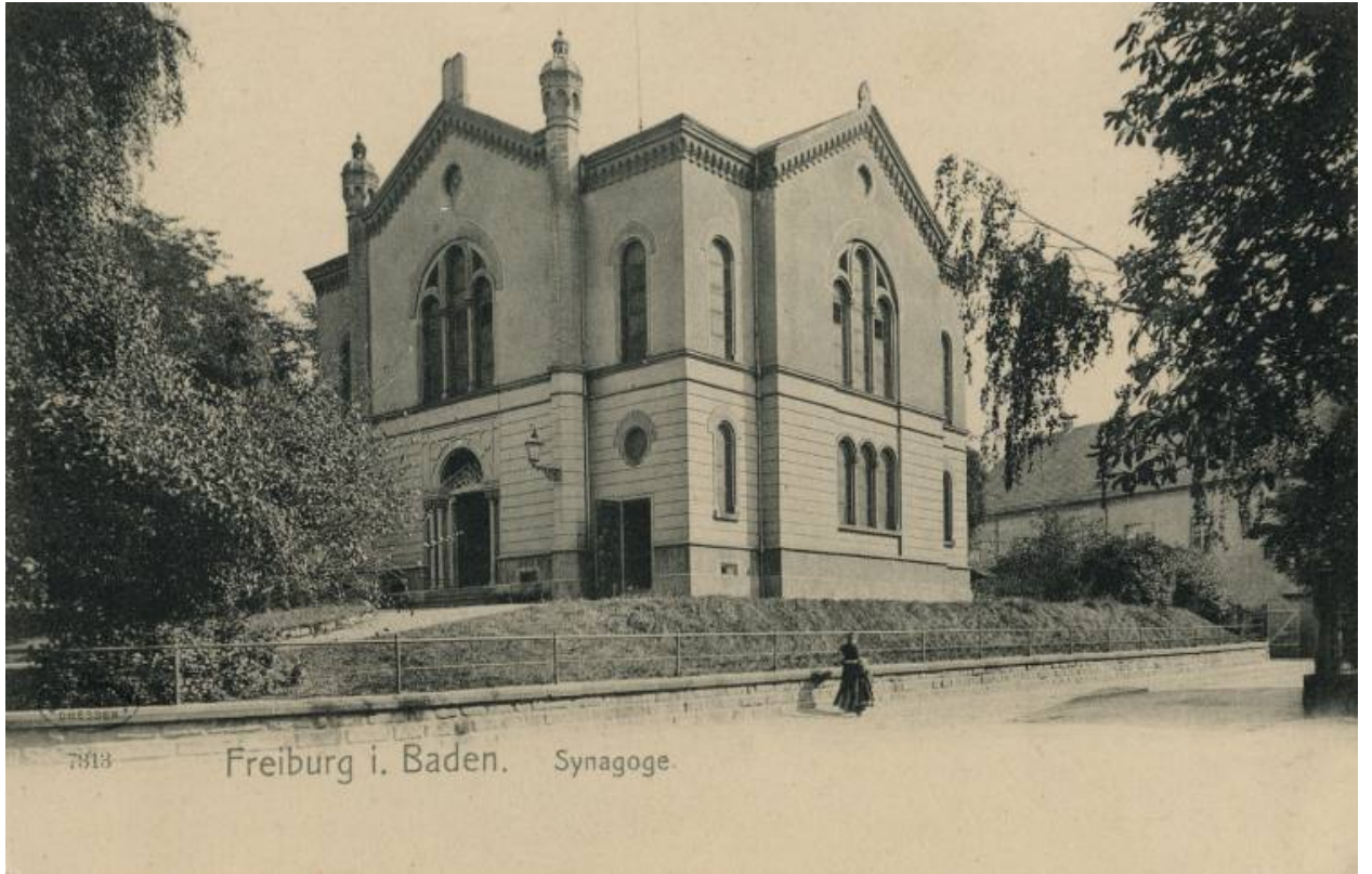
Postkarte der Synagoge von Freiburg, um 1900